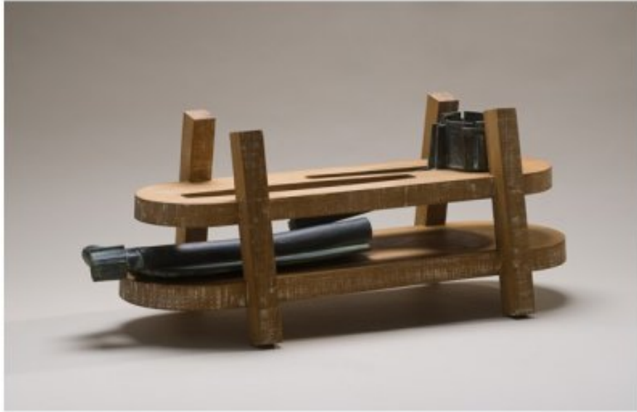
Köz-Test III, 2011, tölgyfa, bronz, 45x70x30 cm.

térbe, van ahol a határoló formák között zajlik, de minden esetben átvezet az egyik elemből a másikba. A Köz-testeken konkrét tárgyakra találunk utalásokat, pl. tölcsérforma, csövek-vezetékek, amelyek átvezetnek egyik szintről a másikba. Ebben a munkában önmagába visszatérő, visszaforduló formákat látunk egy nyitott szerkezetben.