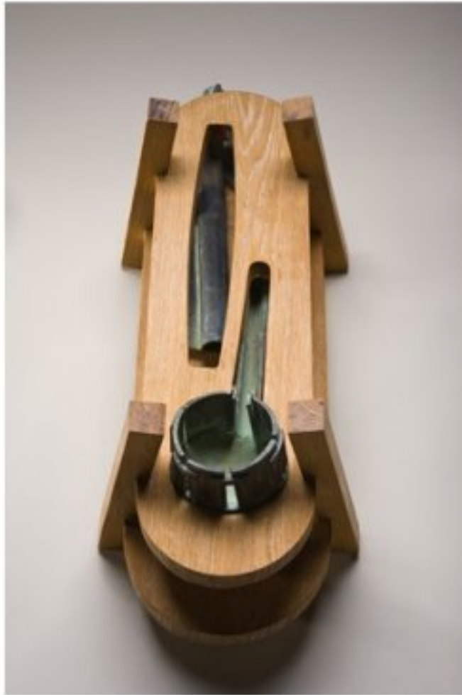
Köz-Test III. 2011, tölgyfa, bronz, 45x70x30 cm.

A Köz-test IV. (2013) inkább egy zártabb doboz forma. Ugyanakkor zártsága ellenére elliptikusok alkalmazásával a szobor-test az ívén billeg, de saját súlypontját megtalálva stabil. Fontos szerepe itt is az áttöréseknek és nyílásoknak van, amelyek ennél a pasztikánál mint kulcslyukak vezetnek a tekintetet a szobor belső történéseibe, a formák folyamatába. Az áttörések lazítják és árnyalják a felületeket. Közöttük itt is egy test van, de kevésbé zártan, mint a korábban bemutatott "nagy szobornál".